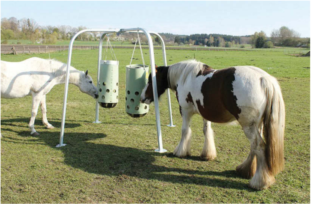
► Abb. 6.2 HeuToy auf der Koppel.